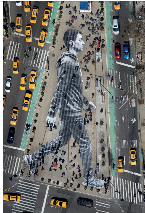
JR, Migrants, Walking New York City , New York, USA, 2015.